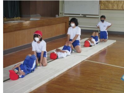
たてわりによるスポーツテスト