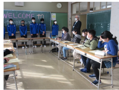
中学校見学会（先輩の話の聞く様子）