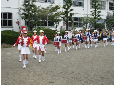
トランペット鼓笛隊発表会