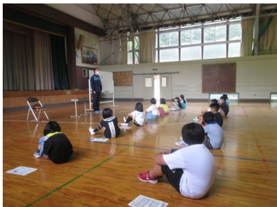
町職員による防災教室